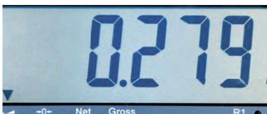
Ecrã LCD retroiluminado